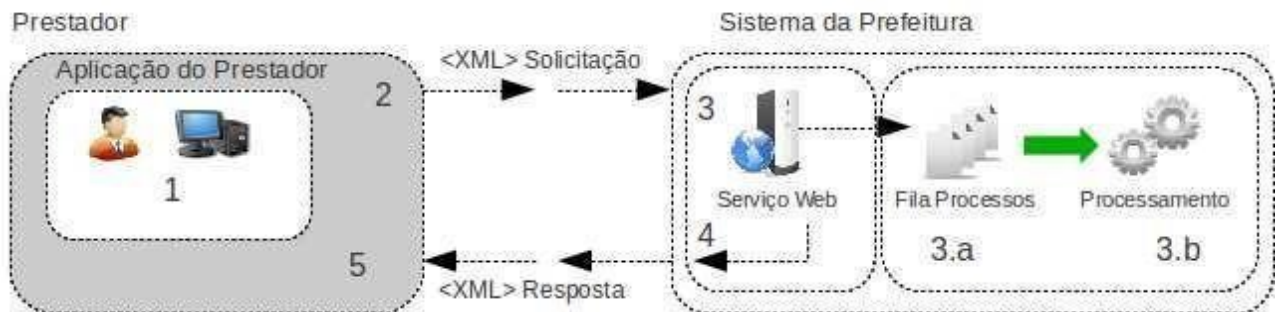
Figura 2: Fluxo de serviço Web assíncrono

As solicitações de serviços de implementação assíncrona são processadas de forma distribuída por vários processos e o resultado do processamento somente é obtido na segunda conexão. Na Figura 2 a seguir tem-se o fluxo simplificado de funcionamento: