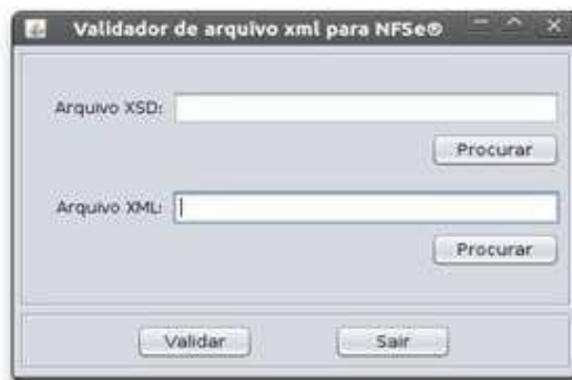
Figura 3: Tela inicial do Validador

No campo “Arquivo XSD” pode ser especificado o arquivo contendo o XML Schema a ser utilizado na validação. Para validar o XML Schema do sistema de DMST-e deve ser indicado o arquivo “SchemaDMSeTomadosCaxias.xsd”, que se encontra na pasta da própria aplicação. No campo “Arquivo XML” deve ser indicado o XML a ser validado.