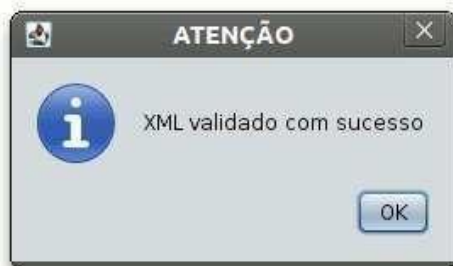
Figura 4: Janela indicando sucesso da validação do XML

Depois de indicados os arquivos e se clicar no botão “Validar”, a aplicação irá confrontar o arquivo XML com as definições do XML Schema. Caso a validação seja concluída com sucesso, aparecerá a janela mostrada na Figura 4 a seguir.