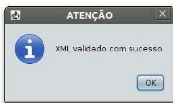
Figura 4: Janela indicando sucesso da validação do XML

Depois de indicados os arquivos e se clicar no botão “Validar”, a aplicação irá confrontar o arquivo XML com as definições do XML Schema. Caso a validação seja concluída com sucesso, aparecerá a janela mostrada na Figura 4 a seguir.