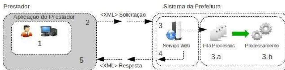
Figura 2: Fluxo de serviço Web assíncrono

As solicitações de serviços de implementação assíncrona são processadas de forma distribuída por vários processos e o resultado do processamento somente é obtido na segunda conexão. Na Figura 2 a seguir tem-se o fluxo simplificado de funcionamento: