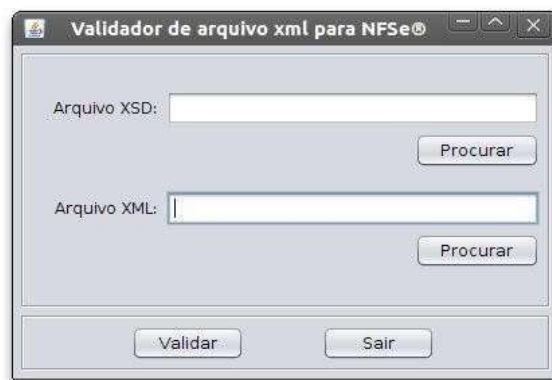
Figura 3: Tela inicial do Validador

No campo “Arquivo XSD” pode ser especificado o arquivo contendo o XML Schema a ser utilizado na validação. Para validar o XML Schema do sistema de NFS-e deve ser indicado o arquivo “NFSe-.xsd”, que se encontra na pasta da própria aplicação. No campo “Arquivo XML” deve ser indicado o XML a ser validado.